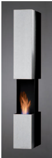
Riviera LE GL