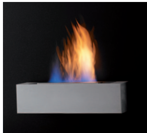
Riviera EN GL