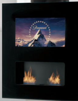
Double Vision čern