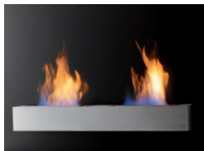
Riviera DU GL